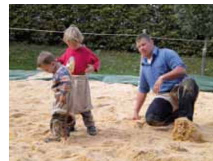
Lutter pour petits et grands

Toute la journée, les attractions ont été nombreuses. Le chemin de fer pour enfants du «Gurtenpark» était à disposition, tout comme un jardin zoologique d'ani-