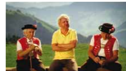
Uwe Ochsenknecht en Appenzell, à la recherche du secret du mélange d'herbes

Après trois ans d'absence de la télévision, l'Appenzeller® table de nouveau sur l'acteur Uwe Ochsenknecht, très appré-