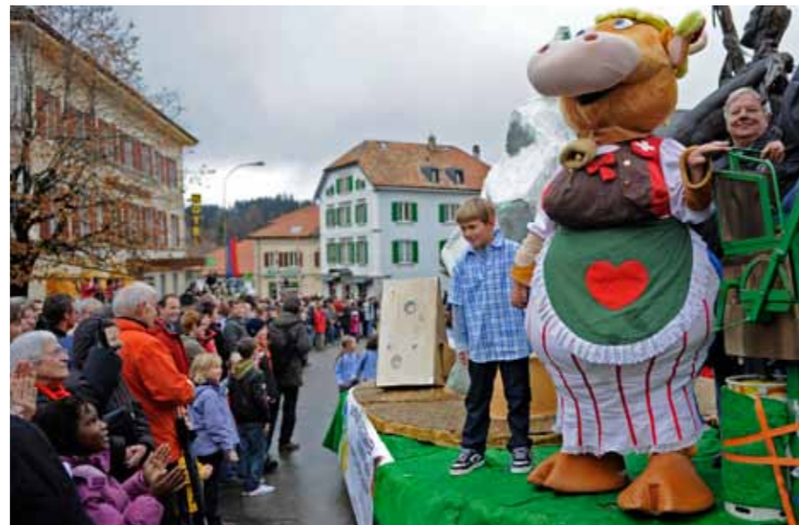
«Mukka Emma» avec le feu olympic

Pour permettre au plus grand nombre possible de visiteurs et de visiteurs de notre site Internet de découvrir la diversité du monde du fromage, nous avons installé un outil de recherche de fromages. Actuellement, plus de 400 sortes de fromages suisses y sont décrites, illus-