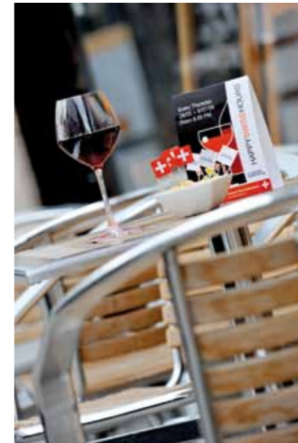
«Happy Swiss Hours» dans les restaurants

Les Belges ont tendance à consommer de moins en moins de bière au profit du vin. En vingt ans, la consommation de vin n'a cessé d'augmenter. Pas étonnant que les bars à vin se soient multipliés et qu'ils aient conquis un grand nombre de Belges.