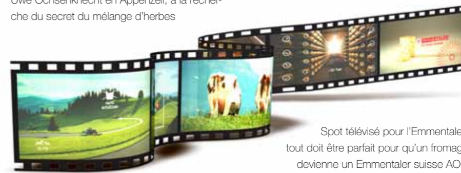
Spot télévisé pour l'Emmentaler: tout doit être parfait pour qu'un fromage devienne un Emmentaler suisse AOC