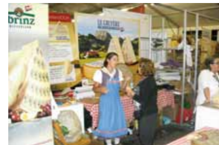
Stand SCM à la foire «Cheese 2009» à Bra

de midi ou du soir, ainsi que des assiettes de fromage composées directement à partir du chariot. Le week-end, les «Happy Hours» seront l'occasion de faire une expérience différente du fromage suisse; il en ira de même le dimanche avec un brunch. Le soir, un programme-cadre supplémentaire sera proposé aux visiteurs. Il s'agira, par exemple, de séminaires consacrés à l'alimentation et aux allergies aux denrées alimentaires, ainsi que de plusieurs cours de cuisine donnés par un cuisinier milanais de renom qui présentera des possibilités d'utiliser les fromages suisses. La préparation correcte de la fondue et de la raclette sera également démontrée et, en même temps, les hôtes apprendront quel vin suisse boire avec quel fromage suisse, etc. Les fromages et des accessoires, comme les caquelons, etc. seront vendus pendant tout le mois.