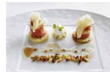
Une création culinaire de Erik van Loo

Le concept «Swiss&Cook» développé par SCM Benelux permet de partager avec des journalistes des moments privilégiés. Quand la cuisine créative est au rendez-vous avec les fromages de Suisse!