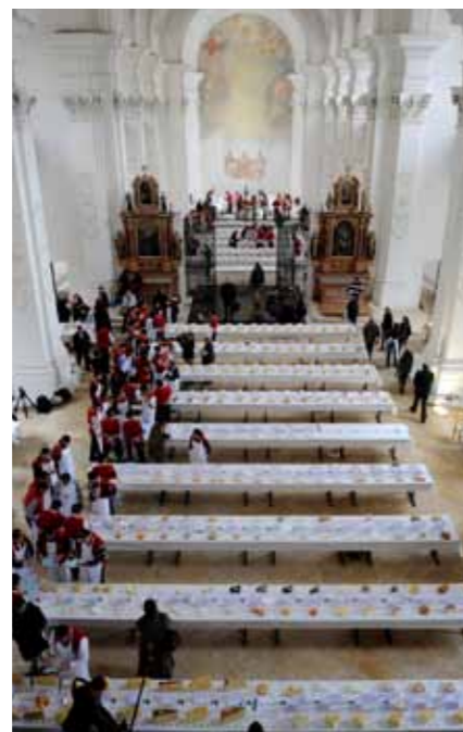
Le jugement dans l'Abbey de Bellelay

trations à l'appui. Nous vous saurions gré de nous informer au fur et à mesure sur les nouveaux fromages, avec des textes et des illustrations, afin que cette importante source d'informations soit toujours à jour. Merci d'avance pour vos envois à info@switzerland-cheese.com !