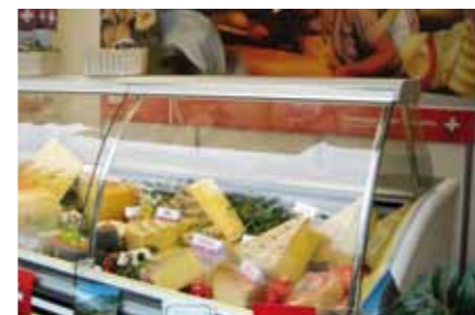
Vitrine avec des sortes de fromage suisses