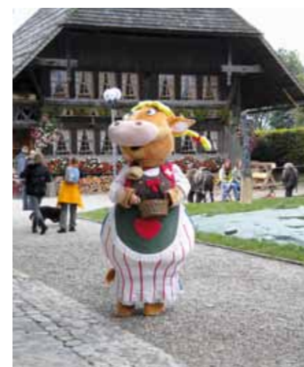
Visite de l'Italie: «Mukka Emma»

maux domestiques avec de jeunes bovins bernois, des chèvres naines, des veaux, des moutons et des ânes. Les enfants pouvaient aussi tester leurs talents de luteur ou observer la fabrication du fromage comme le faisaient nos aïeux, dans un local aux parois noircies par la fumée. Les promenades à dos de poney ont été une autre offre du programme particulièrement appréciée par les enfants. Mais les estomacs non plus n'avaient pas été oubliés: grâce au beau temps, les shake au lait et