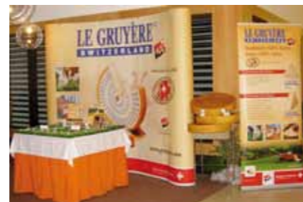
La loge VIP

pas non plus été oubliés; ils ont rapporté à la maison toute une série de souvenirs tels que des bandes fluorescentes, des crayons, des vaches en peluche, etc.