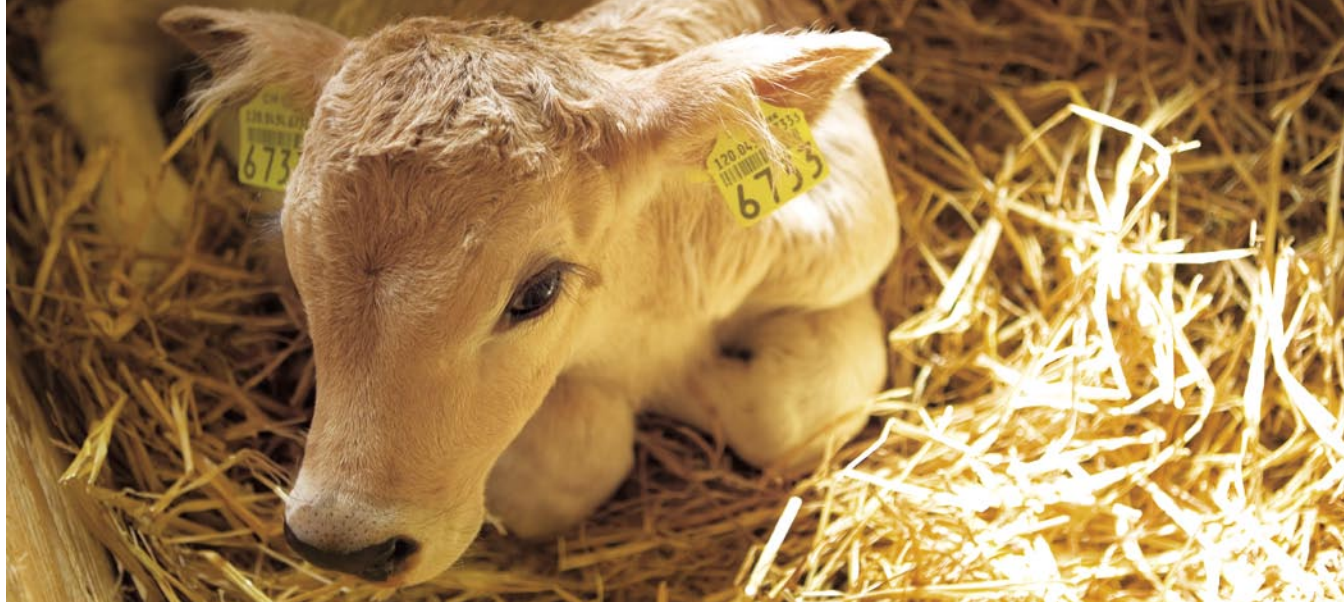
Tilsiter Switzerland à la crème