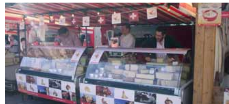
Le stand des fromages de Suisse à la foire d'Antony

Du 14 au 16 septembre 2007, Les fromages de Suisse ont été mis à l'honneur lors de cette 21 ème édition de l'incontournable foire aux Vins et aux Fromages d'Antony, dans les Hauts de Seine, en région parisienne. Sous un soleil radieux, plus de 100 000 visiteurs et amateurs de fromages ont pu découvrir sur un espace suisse en plein air de 200 m 2 : divers stands de dégustation-vente où tous Les fromages de Suisse étaient présents, la pinte à fondue avec 60 places assises, la fabrication du fromage en direct 2 fois par jour, et des «ateliers du goût» destinés à faire découvrir aux grands et aux plus petits toute les richesses des fromages de Suisse.