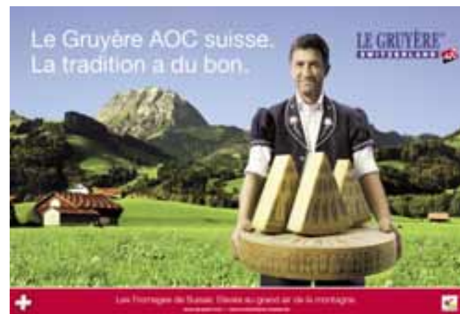
La tradition a du bon avec Le Gruyère AOC

La campagne de promotion de Le Gruyère AOC s'encre dans les grandes valeurs du fromage tel qu'on l'aime depuis toujours: la tradition de sa fabrication, l'authenticité de son goût et le savoir-faire de toute une région productrice. Elle présente en outre les 3 variétés commercialisées en Belgique: