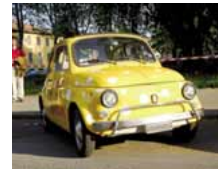
Une FIAT 500 au dessin Emmentaler AOC

Emmentaler AOC a continué à communiquer l'obtention de son AOC avec une série de manifestations regroupées en plusieurs éléments. Le premier élément a été le lancement d'un concours de photos ouvert au public, par l'envoi de 10 000 SMS. Plus de 20 000 cartes postales ont été distribuées par l'intermédiaire de 5 promoteurs qui, pendant 28 jours, entièrement habillés de jaune à trous, ont parcouru 4 villes italiennes en vélo. En même temps, 6 autres jeunes ont circulé dans tout Milan à bord de 3 FIAT 500 jaunes, distribuant des cartes postales à tous les points névralgiques de la ville (Université, centre ville). Ces cartes expliquaient comment participer à ce concours dont le nom «Trous, la magie de l'espace vide», était le thème à interpréter et à photographier. Les participants ont donc expédié leurs photos et un jury a sélectionné les trois gagnants. En même temps, des photos existant déjà sur ce thème, mais étant cette fois l'œuvre des photographes