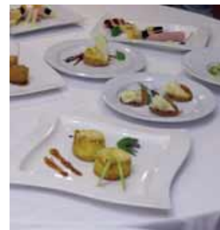
Les créations avec les fromages de Suisse

Entre juin et septembre, trois voyages de presse avec la participation de 14 journalistes de presse, radio et TV ont été réalisés dans les régions de la Tête de Moine AOC, Le Gruyère AOC, l'Emmentaler AOC, le Sbrinz AOC et l'Appenzeller®.