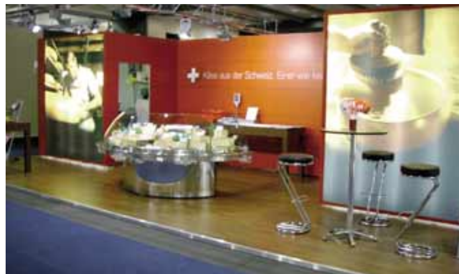
Les foires gastronomiques et le stand SCM étaient un réel succès

Une continuation conséquente est prévue pour 2008; les organisateurs de foires et salons augmenteront le nombre de ces précieuses foires dans les grandes villes et agglomérations.