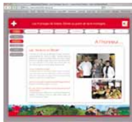
Le site internet www.switzerland-cheese.be sera en nouveau look bientôt

Un nouveau site internet de SCM Benelux verra le jour au printemps. La proximité, la convivialité et l'interactivité seront au rendez-vous sur switzerland-cheese.be .