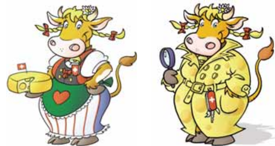
La sympathique vache «Mukka Emma» en action

2008 est l'année où, pour le compte de l'interprofession Emmentaler Switzerland, SCM Italie lance le nouveau personnage venant de la Vallée de l'Emme: «Mukka Emma», la sympathique vache qui tient un hôtel. À ses moments perdus elle enquête sur les mystères des vallées suisses. Le lundi 10 mars, une conférence de presse a eu lieu à Milan pour présenter en avant-première aux journalistes italiens, la longue série d'activités auxquelles elle va participer. Par exemple, le lancement des deux premiers livres de ses aventures, publiés par «Giunti Editore». Les livres seront distribués dans les librairies de toute l'Italie. Ensuite il y aura un concours dans la grande distribution où, en achetant au moins 250g d'Emmentaler AOC, les participants pourront recevoir de sympathiques gadgets «Mukka Emma», mais aussi participer au tirage au sort final pour gagner 6 «Mukka cards» de 2000 Euro en total.