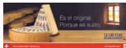
Affiche de publicité pour Le Gruyère AOC

3000 actions promotionnelles avec des assortiments de fromage suisse ainsi que 900 actions spécifiques à des sortes ont