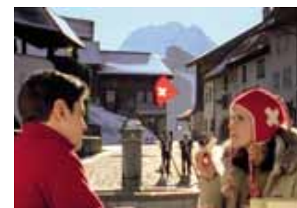
Scène du spot TV Le Gruyère AOC

Après une présence massive en affichage dans le métro et sur le boulevard périphérique parisien ces dernières années, Le Gruyère AOC investit désormais le petit écran. Pour la première fois en France, Le Gruyère AOC prend la parole en 2008 avec le média de masse par excellence, la publicité en TV, sur les deux plus grandes chaînes françaises que sont TF1 et M6, avec un film original de 20 secondes.