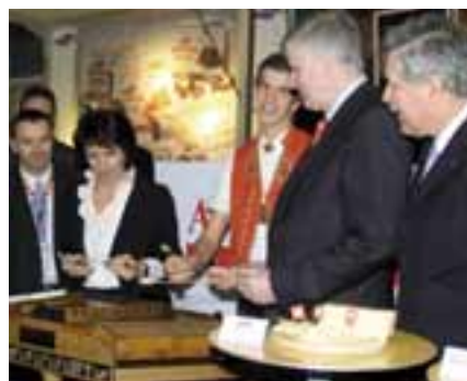
Doris Leuthard, Conseillère fédérale, à la «Semaine verte internationale»

Du 18 au 27 janvier 2008, la Suisse a été le pays hôte du plus grand salon des consommateurs en Allemagne: la «Semaine verte internationale» (Internationale Grüne Woche), à Berlin, qui a accueilli 425 000 visiteurs. Par conséquent, la Suisse a retenu fortement l'attention des médias et des visiteurs. AMS avait mis sur pied un important programme, conçu un stand d'exposition entièrement nouveau à cette occasion, et organisé la communication spécifique-