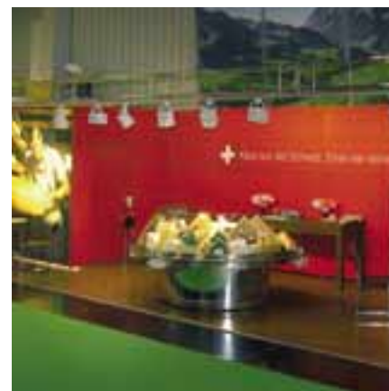
Présence à la foire «BioFach» à Nuremberg

Allemagne. Le développement rapide et continu de ce thème prouve que les produits biologiques sont devenus un besoin des consommatrices et consommateurs. Il est important, dès lors, d'être présent précisément à ce moment pour se positionner avec des produits de marque et se présenter au commerce de manière ciblée.