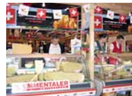
Les fromages suisses au «Salon International de l'Agriculture» à Paris

Plus de 608 000 visiteurs se sont rendus cette année au salon. Et une nouvelle fois, l'espace suisse installé au cœur du hall des «Délices du Monde» et repéré par cet immense drapeau suisse, a remporté un succès. Près de 50 personnes ont œuvré pendant 10 jours pour accueillir les visiteurs, leur faire découvrir et apprécier toutes les spécialités suisses: les fromages suisses, et autres spécialités culinaires vaudoises, ainsi que des animations tels